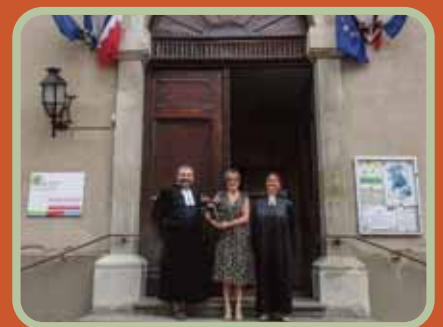
Culte du 2 août 2020