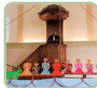
Culte de rentrée - le 20 septembre 2020