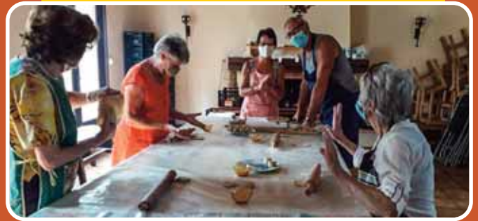
Confection des oreillettes le 17 septembre 2020

Repas et loto se dérouleront à Rouvière, si les décisions préfectorales nous y autorisent. Nous comptons sur votre présence.