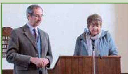
Culte à Saint-Amans-Valtoret