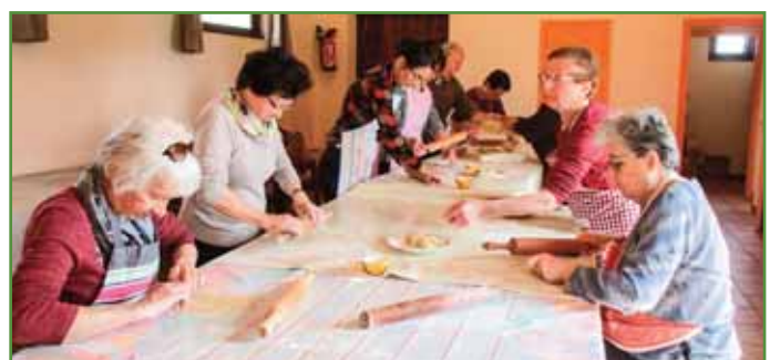
La traditionnelle préparation des oreillettes