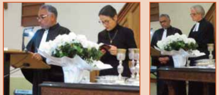
Cérémonie du 26 mai