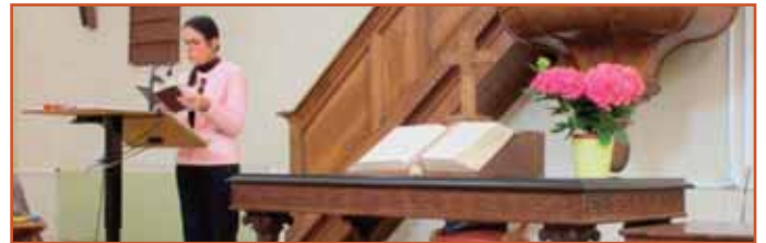
Culte du 28 avril