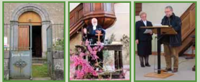
Prière Oecumenique - Calmon - 17-05