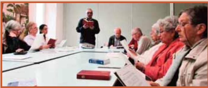
Prière Oecumenique - 16-05